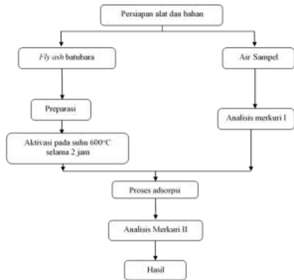
Gambar 1. Diagram Alir Prodesur Penelitian

proses adsorpsi dipisahkan dengan kertas saring whatman .